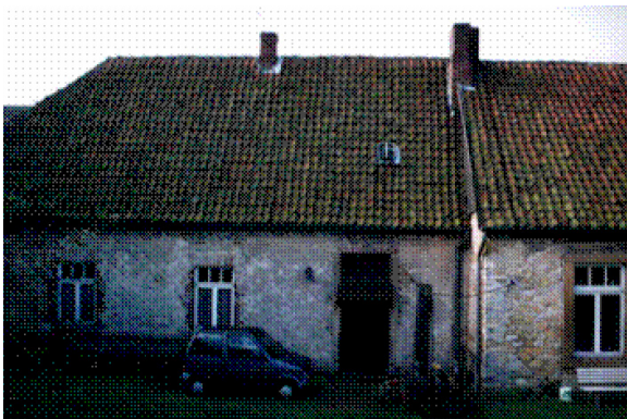
Die alte Schulstube erhält in der Försterzeit zwei Nordfenster und eine Tür. Die Tür zur Küche (rechts) wurde geschlossen.

1888 entsteht ein „Bau-Inventarium von dem Forstetablisement in Rulle“ 39 , das vom derzeitigen Förster Otto Robert Tappert (1883 bis 1904) durch Unterschrift anerkannt wird. In demselben Jahr war nach Norden hin ein Erweiterungsbau von 9,60 Meter mal 7,00 Meter an den Dielen- und Stallteil des Lehrerhauses angesetzt worden. Auch sonst sind einige Eingriffe in die Bausubstanz gemacht worden.