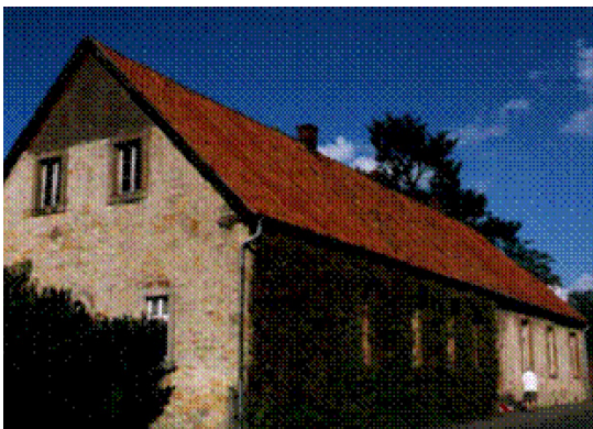
Die Alte Försterei von Westen gesehen.

Das erste gemeindliche Haus war in Rulle das 1820 erbaute Schulhaus. Mächtig muss das 30 Meter lange Gebäude auf dem „Kleinen Hügel“ gewirkt haben. Wie schon die Kapelle zuvor, wurde es mit hiesigen Bruchsteinen gebaut, geputzt (gerappt) und geweißt.