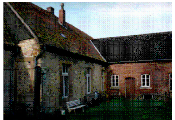
Lehrerwohnung mit Brunnen und Pumpe im Vordergrund.

Nach Osten wurde das Grundstück zur Wegseite von einer 8,50 Meter langen und 2,30 Meter hohen „Hofeinschluss mauer“ aus Ziegelsteinen mit Sandsteinkapfen begrenzt. Ein hohes eichenes Brettort verschloss die Einfahrt. Zum Hof hin hatte die Schule nur ein Fenster nach Osten. Die schmalere alte Kapelle bildete mit dem breiteren Wohnhaus einen Gebäudewinkel (siehe Foto rechts 24 ). geweisst. Nahe dieser Stelle ist 1820 ein Ziehbrunnen gegraben worden, wenige Schritte vom Eingang zur Küche. Markant war das Rundbogentor zur Dreschdiele mit Sandsteingewänden, „Absetzer-Schlußstein und Kämpfer“ 25 .