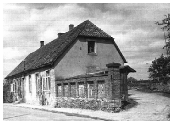
Im Vordergrund die Schulstube. Der Schulhof wurde durch ein hohes eichenes Tor betreten.

Die neue Balkendecke wird mit Tannendielen verschalt. Der eichene Fußboden liegt 65 Zentimeter über dem Flurniveau der Kapelle 19 , die Raumhöhe ist somit noch 3,45 Meter.