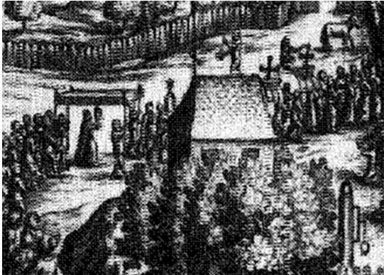
Prozessionsbild mit dem „rullischen Heigthum“ vor 1680.

Aus verschiedenen Quellen lässt sich ein ziemlich vollständiges Bild der historischen Kapelle nachzeichnen. Eine gute Orientierung gibt zunächst der Kupferstich von Johann Heinrich Löffler, der auf einem Wallfahrtszettel aus der Zeit um 1680 nachgedruckt worden ist 2 .