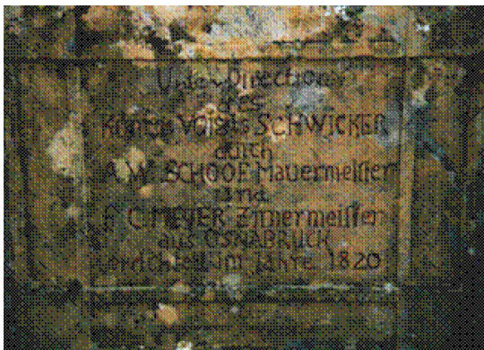
Der Grundstein ist 1921 am Umgang zum Marienbrunnen eingemauert worden.

Es ist zu lesen, dass Zimmermann Meyer für die Schulbänke „Holz aus der alten Kirchspielkirche genommen“ hat. „Zur Einlassung in die Schreibbänke lieferte der Kupferschläger Hammersen 50 Stück bleierne Tintenfässer“. In Richtung des Lehrerstuhles sollte die Höhe der Bänke abnehmen. Zimmermeister Gattman aus Rulle lieferte eine Rechentafel. Der Eingang zum Schulhaus war von der „Fahrwegseite“ her. Von dort betrat der Lehrer seine Wohnung und die Schüler durch die alte Portaltür die Schulstube.